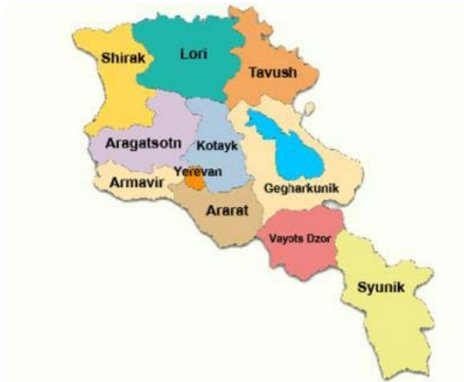
Պատկեր 1 Կոտայքի մարզը և Հայաստանի այլ մարզերը

Հայաստանի Հանրապետության Քաղաքաշինության Նախարարությունը (“ՔՆ”) դիմել է Վերակառուցման և Զարգացման Եվրոպական Բանկին (“ՎԶԵԲ” կամ “Բանկ”) Կոտայքի մարզում տարածաշրջանային սանիտարական աղբավայր նախագծելու և ֆինանսավորելու խնդրանքով: Սա կլինի առաջին սանիտարական աղբավայրը երկրում: Կոտայքի տարածաշրանը ընտրվել է Երևանին մոտ գտնվելու պատճառով՝ նպատակ ունենալով ստեղծել ցուցադրական նախագիծ ողջ երկրի համար (Պատկեր 1). Նախագիծը կմեղմացնի բնապահպանական վտանգը և կդիմակայի բացասական ազդեցությանը հողի և ջրային ռեսուրսների վրա: ՔՆ-ը նպատակ ունի կառուցել երկրին ծառայող յոթ տարածաշրջանային սանիտարական աղբավայր: