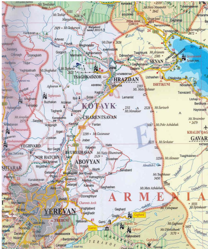
Պատկեր 2 Կոտայքի մարզի և Սևան ֆոնի ֆարակ