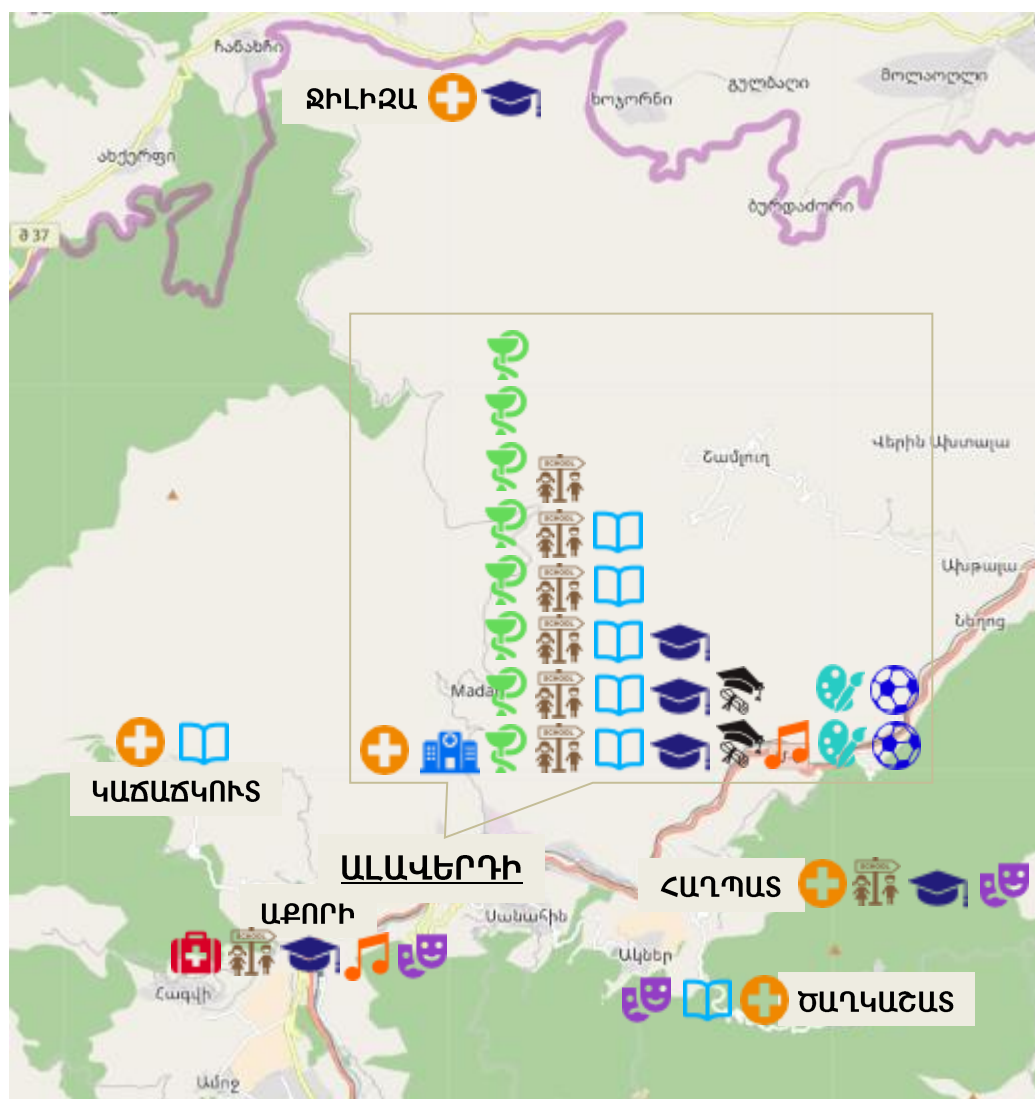
Քարտեզ 2. Ալավերդի համայնքի կրթական, առողջապահական ու մշակութային հաստատությունների տեղաբաշխումը

Համայնքի կրթական, առողջապահական ու մշակութային հաստատությունների տեղաբաշխումը ներկայացված է քարտեզ 2-ում: